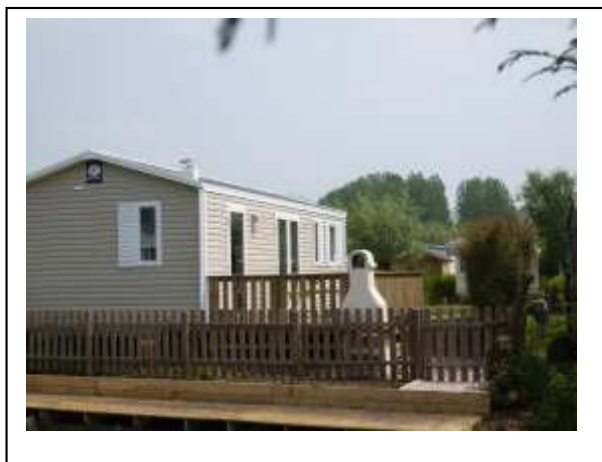
Locatif avec terrasse et ponton pour la pêche