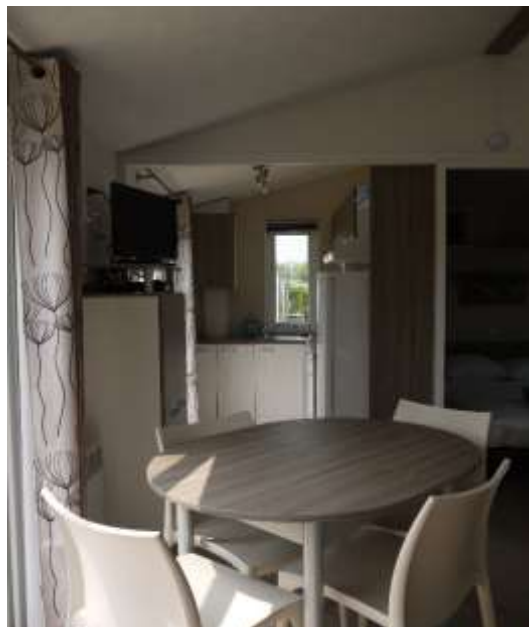
Intérieur du mobil home

draps et linge de toilette, nettoyage en fin de séjour et réparations des dégâts éventuels.