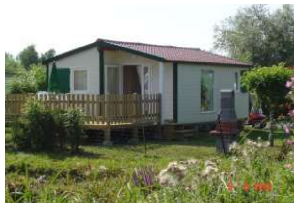
Terrasse du chalet