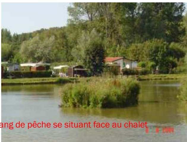
Etang de pêche se situant face au chalet