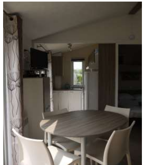
Intérieur du mobil home

draps et linge de toilette, nettoyage en fin de séjour et réparations des dégâts éventuels.